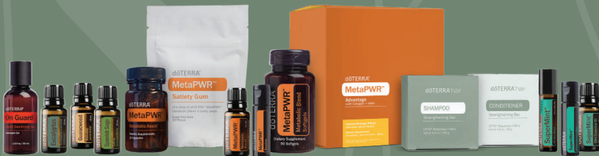
Tabla de contenido:

Capítulo 1: Aceite Esencial de Madera de Guayaco